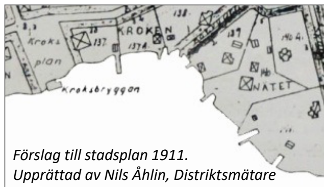
Förslag till stadsplan 1911. Upprättad av Nils Åhlin, Distriktsmätare

Barnen leker på Kroksbryggan, kanske i väntan på ångbåten från Stockholm. I bakgrunden ligger Skansberget och Eklunds udde med sin bebyggelse.