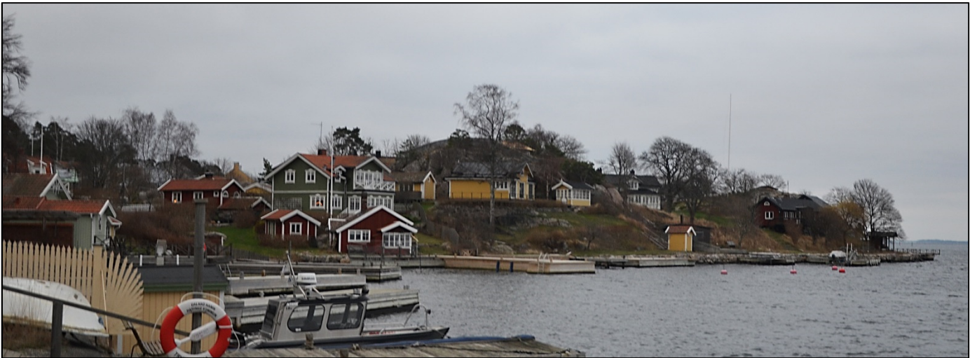
Nedan bilder från 2020.