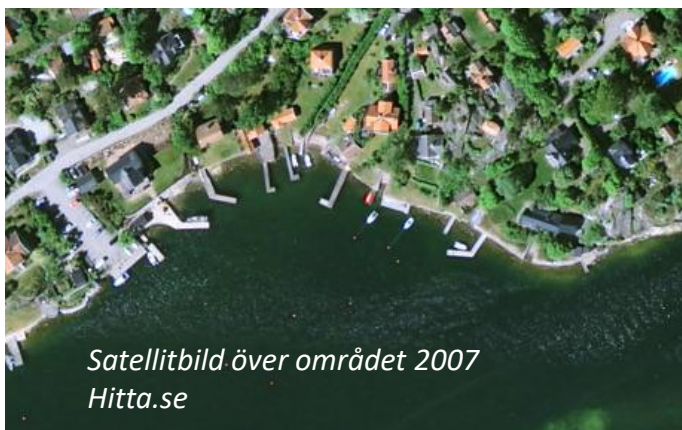
Satellitbild över området 2007

Längst ut på Eklunds udde befallde Gustav II Adolf år 1623 att allmogen i Sotholms härad skulle bygga en försvarsskans för Stockholms södra inlopp. Den skansen dömdes snart ut och Dalarö Skans började byggas på ön Stockskäret år 1656. Av skansen på Eklunds udde finns inga lämningar kvar förutom en vall vid stranden, på en privat tomt, som kan ha tillhört försvarsanläggningen.