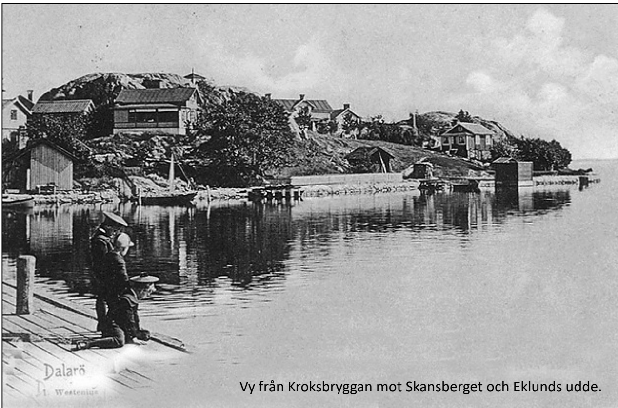
Vy från Kroksbryggan mot Skansberget och Eklunds udde.