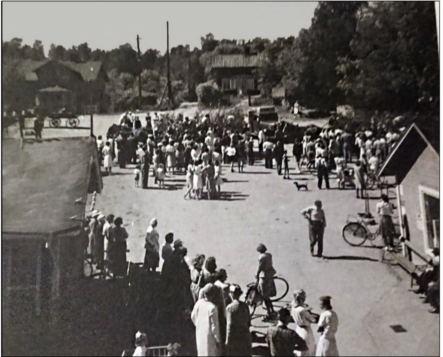
Midsommarfirande samlas vid torget, bilden är troligtvis från slutet av 1940-talet.