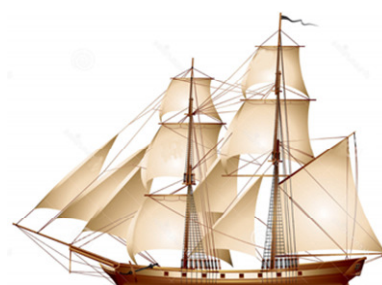
toppsegelskonare - brigantin.