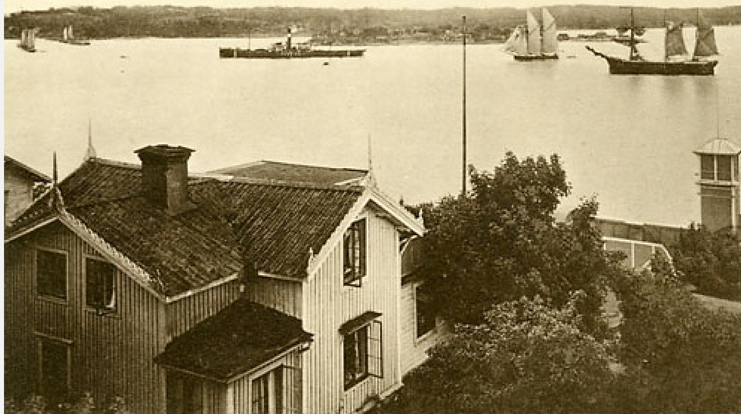
Utsikt från Dalarö