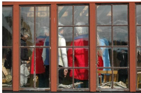
Förevisning av naturnära slöjd