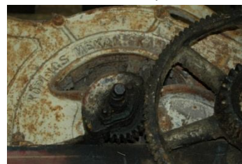
Ateljé / Museum