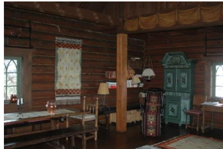
Interiör från Jaktstugan / Ryssvillan