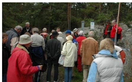
Samling inför promenaden längs ön