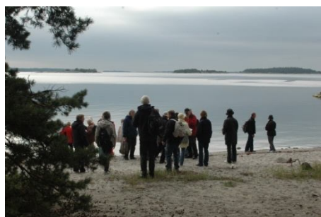
Badstranden i öster