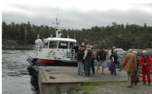
Öfararen vid norra viken

Huset - På Mörtö-Bunsö finns skärgårdens mest synliga sommarställe. Från verandan, 39 meter över havet, är utsikten vidunderlig och det är ett av få hus som är speciellt utsatt på sjökortet. Det var 1905, mitt under jugendepoken som huset timrades, i tung allmogestil. Brunt timmer både utvändigt och invändigt, grova takbjälkar, vitmenade öppna spisar.