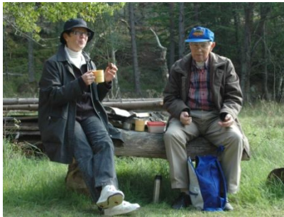
Dags för en kopp kaffe och en smörgås