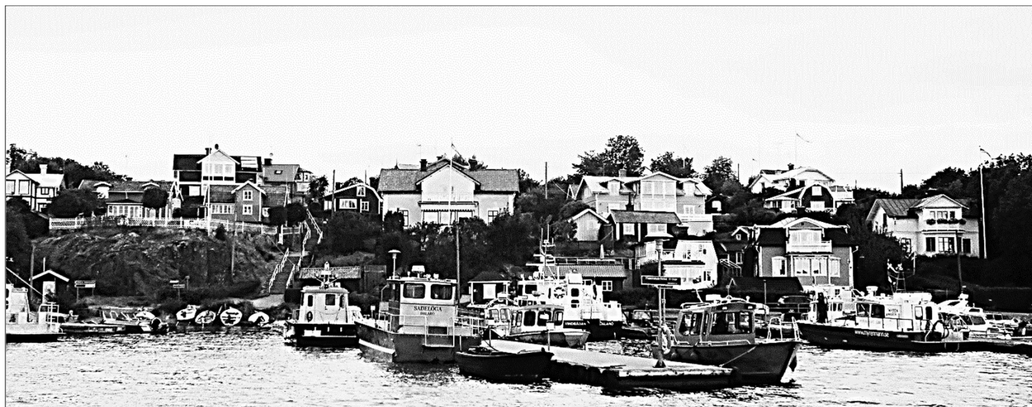
Foto från juli 2016. Yrkesbåtar, taxibåtar och mindre privata rodd- och motorbåtar måste samsas om utrymmet.