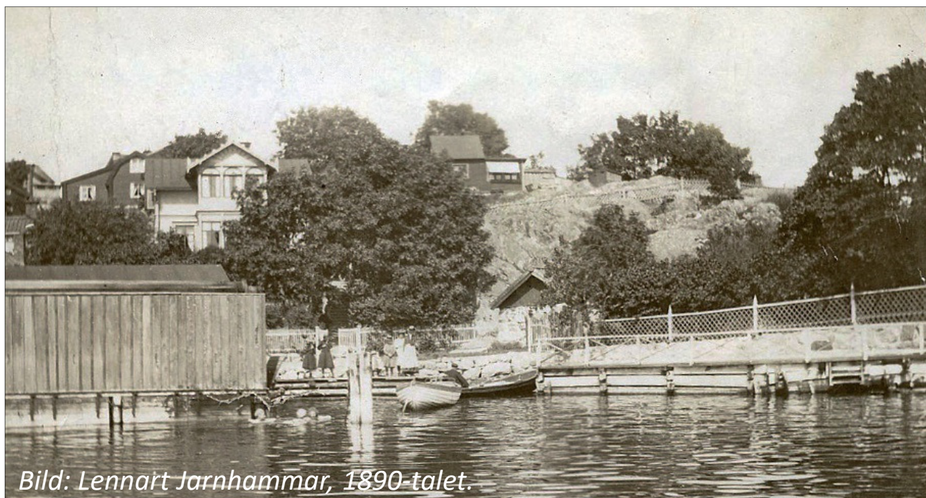
1890-talet.

Kallbadhuset (1859-1910) i Fiskarhamnen. Vi ser fem kvinnor betrakta tre män som badar utanför inhägnaden eller badsumpen avsedd för badande i badhuset. Det var ovanligt att bada oskyddat i havet på den tiden.