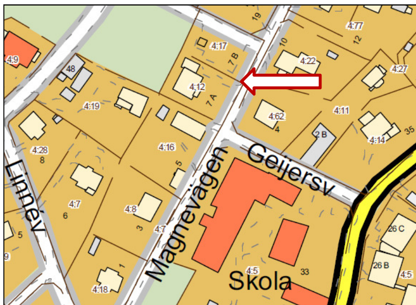
Karta från 2009.