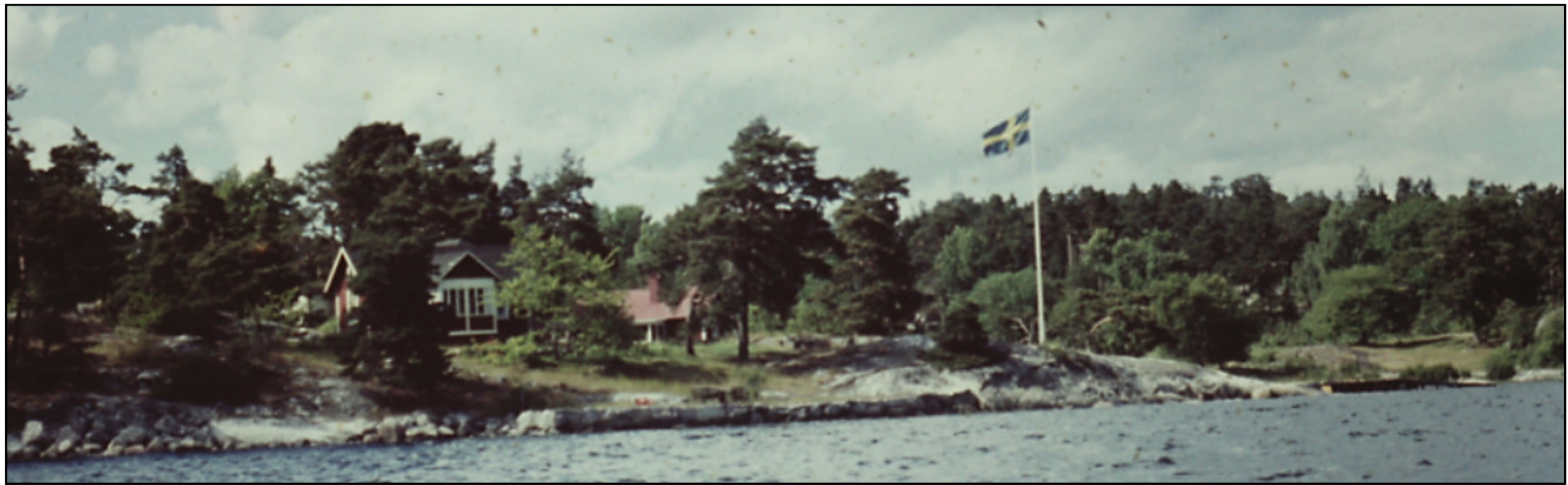
Stubbviken. Västertorp 1:41. Holmdalsvägen 8.

Det finns mer att läsa om Stubbvik i DHF:s redovisning SC166.