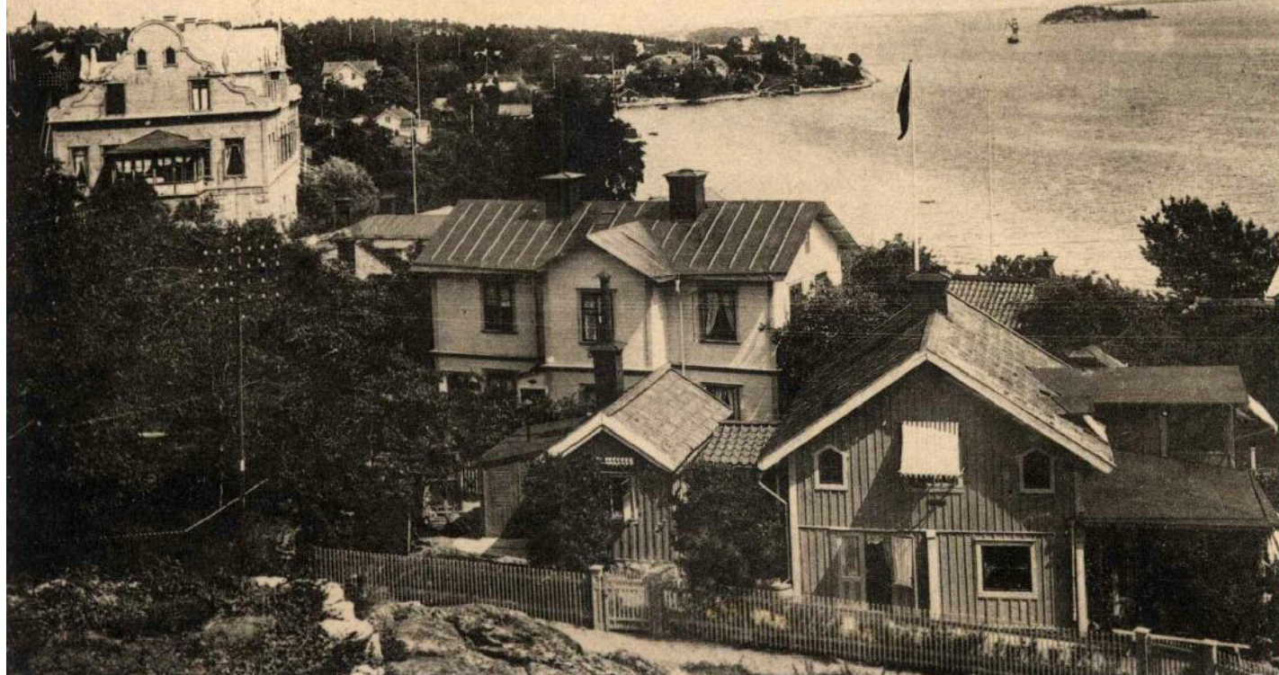
Dalarö. Utsikt över Jungfrufjärden.