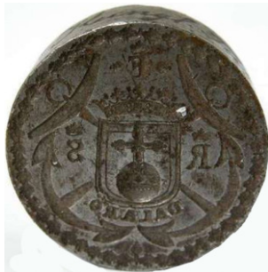
Tullstämpel från slutet av 1800-talet. Nordiska Muséet

Observera den vackra gaslyktan som står till vänster på vägen mot Hotellbryggan. Elektriciteten kom till Dalarö 1922