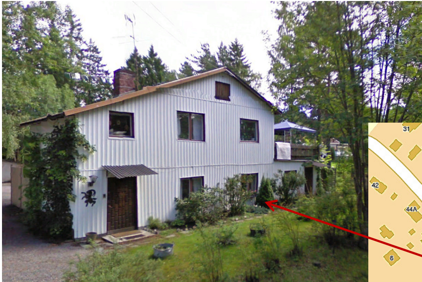
Vadet 3:72 Ornövägen 1