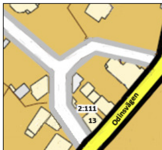
Fiskeboden på Odinsvägen 13 målad av Monica Svahn.

Vi tar tacksamt emot kompletterande uppgifter om denna bild. information@dalarohembygd.se