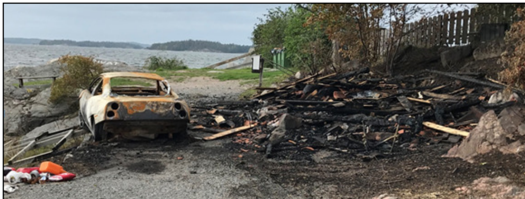
I slutet av Dalarö Strandväg, nedanför Berghamnsbacken.

Förövarna var två män i 30-årsåldern, som straxt därefter greps. De släppte även lös en större båt från intilliggande brygga som de försökt att stjäla. Båten hittades drivande med kapade bryggampar.