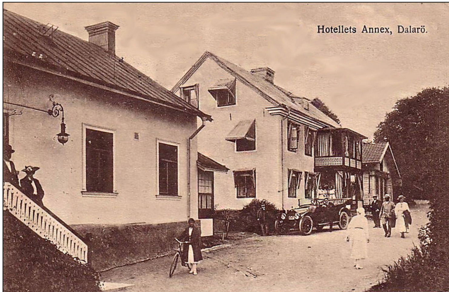
Hotellets Annex, Dalarö.